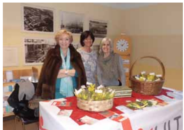
Festa delle Donne: il giallo della condivisione

Il giallo della mimosa, diventa il giallo della condivisione e della speranza! L'8 marzo eccoci qua, noi Volontarie e donne, impegnate, tra chiacchiere leggere e scoppi di allegre risate, a recidere rami e a comporre tanti mazzetti gialli per farne piccoli frammenti di solidarietà. Mani generose ripagheranno poi l'impegno profuso. In questo modo la festa dell'8 marzo da qualche anno è diventata, da noi, un prezioso momento di ricchezza umana, ricchezza che si riversa su tutti coloro che continuano a spendersi nei numerosi fronti della malattia e su coloro che possono usufruire di tanta generosità.